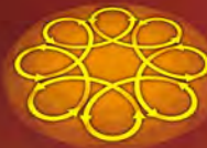
パッドの偏心軌道イメージ