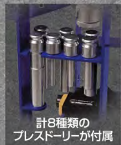
計8種類の プレスドローが付属

最大能力 15ton 最大ストローク 98mm サイズ / 重量 H854mm W564mm D354mm テーブル内幅440mm / 53kg