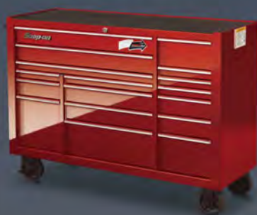
ツールシングルバンク