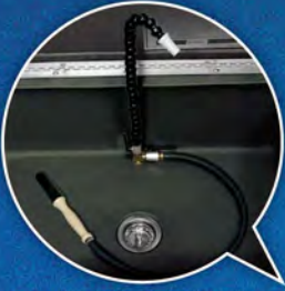
フレキシブルノズルおよび洗淨ブラシを標準搭載。