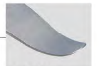
アールの付いた プライバー