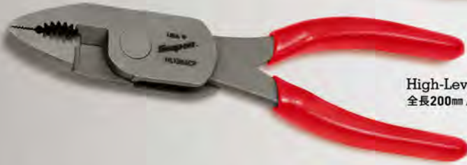
High-Leverage Pliers 全長200mm / ジョウ開口幅27mm