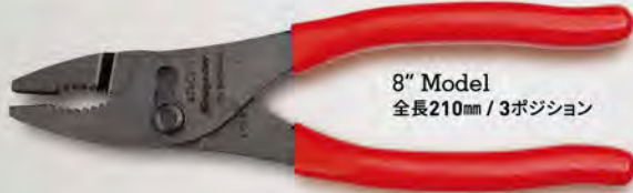
8" Model 全長210mm / 3ポジション