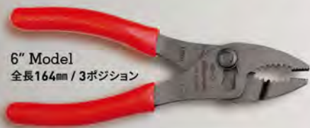
6" Model 全長164mm / 3ポジション