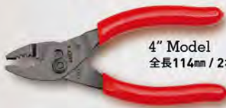
4" Model 全長114mm / 2ポジション