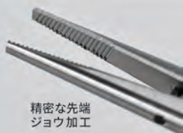
精密な先端 ジョウ加工