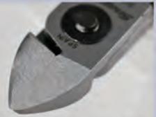
刃先はツールフラッシュカット 軟線、樹脂用