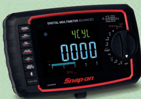
・収納ケース付属