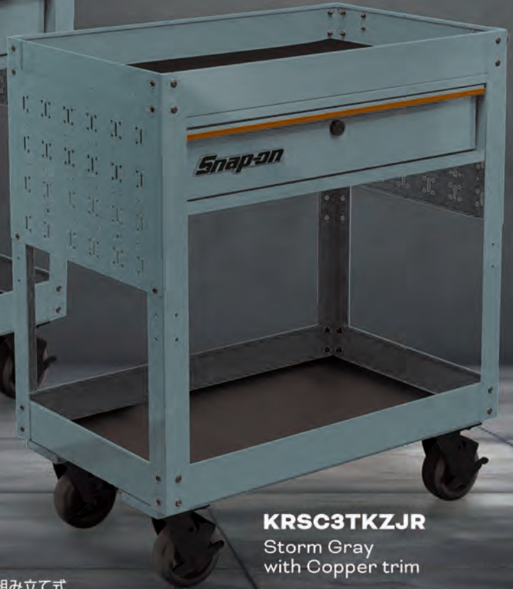
KRSC3TKZJR Storm Gray with Copper trim