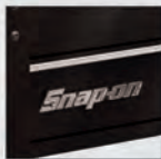
KRSC3TKPC Gloss Black