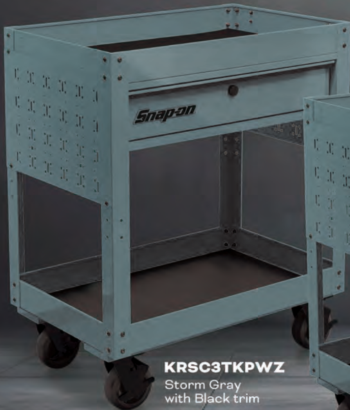
KRSC3TKPWZ Storm Gray with Black trim