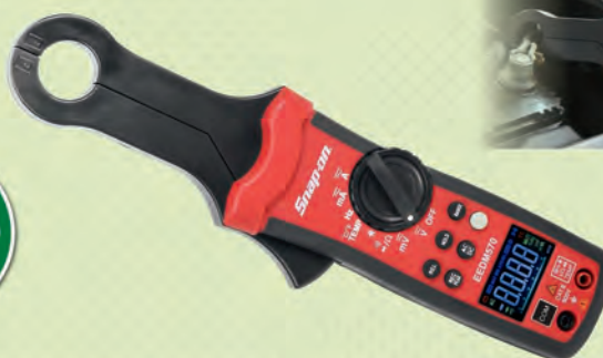
交流および直流に対応

・測定電流: 1mA~100A・測定カテゴリ: CATⅢ ・ディスプレイ: カラー液晶・TRUE RMS ・メモリ機能: 最大値・最小値・平均値