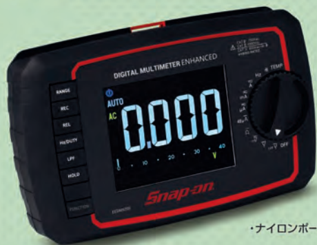
・ナイロンポーチ付属

■ Enhanced 大型カラーディスプレイ搭載。EV/ハイブリッド車対応の次世代型中級モデル