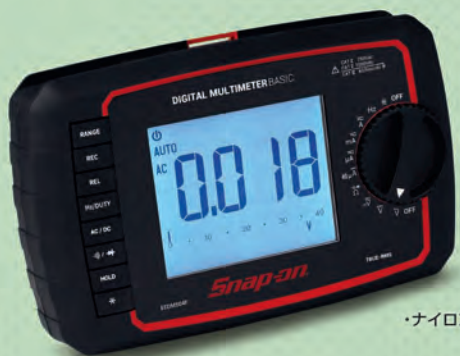
・ナイロンポーチ付属