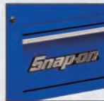
KRSC3TKPCM Royal Blue