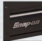
KRSC3TKPOT Flat Black