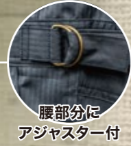
腰部分にアジャスター付